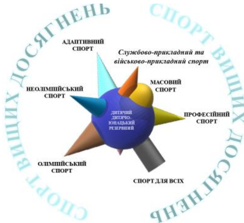
Рис. 1. Рівнева диференціація соціальних практик спорту

інших видовищних заходів і перетворився на потужний сектор економіки.